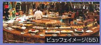
ビュッフェイメージ(55)