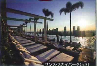
サンズスカイパーク(53)