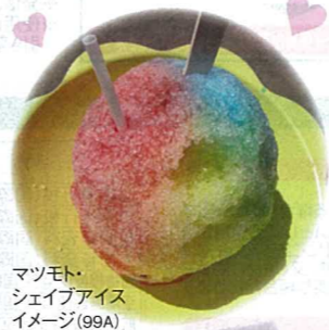
マツモト・シェイブアイス イメージ(99A)