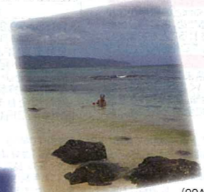
ラニケアビーチでは海がめに会えるかも(99A)