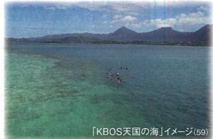
「KBOS天国の海」イメージ(59)

スケジュール [08:40頃]ホリデイデスク発→モアナアガーデン→ドールプランテーション→マツモト・ストア、ハレイワの街→ラニケアビーチ [12:30頃]カネオへ湾到着、ボートで「天国の海 サンドバー」へ、昼食後シュノーケリング [17:00頃]ホリデイデスク着 ※その日の交通状態や天候状態によってやむをえずコースの変更や時間の遅れが発生する場合があります。ご了承ください。 ※日曜日と5/28、7/4にあたる場合、ご案内日時を3日目に変更してご案内します。