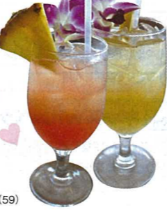
ドリンクイメージ(59)

スケジュール [16:10~16:30頃]ホリデイデスク発 [21:10~21:30頃]ホリデイデスク着 ※最終日が7/4にあたる場合、7/3に変更してご案内します。 ※8日間コースで延泊された場合は、最終日の夜ではなく6日目夜のご参加となります。