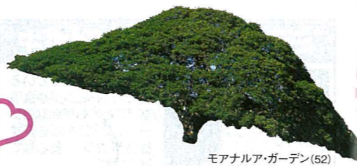
モアナラア・ガーデン(52)

ハネムーンにおすすめのハワイらしさに溢れるスポットへの観光・アクティビティが付いたプランです。 Have a nice trip ♡