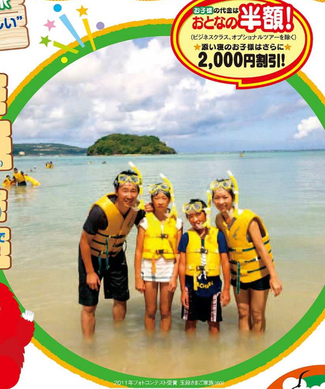
2011年フォトコンテスト受賞 玉段さまご家族(60)