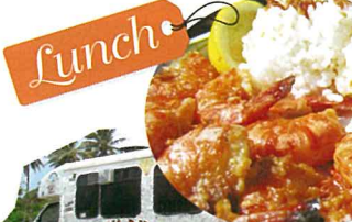
Lunch ▲ランチワゴン ジョバンニの ランチ(57)