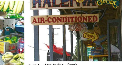
▲ハレイワタウン(57) サーファーの町で、のんびりした雰囲気 のショップやカフェがオススメ。