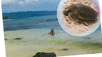
岩場があり、そこがウミガメのお昼寝スポット。 ▲ラニアケアビーチ(57)