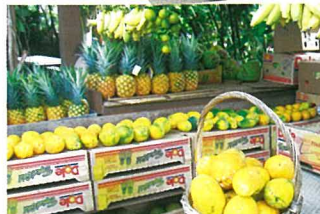
▲フルーツスタンド(57) フレッシュなトロピカルフルーツの試食を楽しめます。