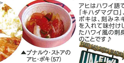
アヒはハワイ語で「キハダマグロ」、 ポキは、刻みネギを入れて味付けした ハワイ風の刺身の ことです。 ▲プナルウ・ストアの アヒ・ポキ(57)