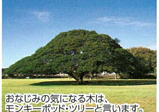
おなじみの気になる木は、 モンキーポッドツリーと言います。 ▲モアナア・ガーデン(57)

ハレイワ、モアナアガーデン、ドールプランテーションなどの名所はもちろん、ジョバンニのガーリックシュリンプやアヒホキなどB級グルメも楽しめる見どころ満載の1日充実観光ツアー!