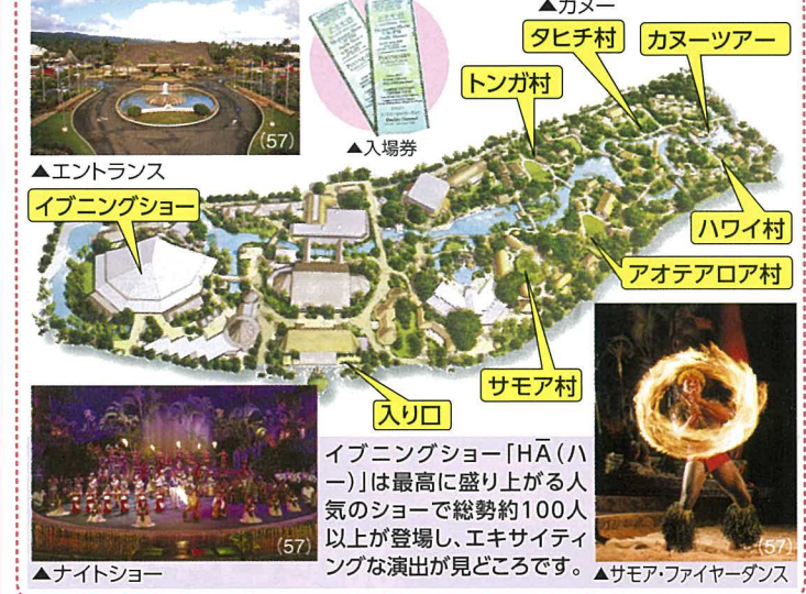
▲カヌー タヒチ村 カヌーツアー ▲トンガ村 ▲ハワイ村 ▲アオテアロア村 ▲サモア村 ▲イブニングショー「HĀ (ハー)」は最高に盛り上がる人気のショーで総勢約100人以上が登場し、エキサイティングな演出が見どころです。 ▲サモア・ファイヤーダンス ▲ナイトショー

約17万m 2 の広大な敷地にポリネシアンのビレッジを再現し、園内の各所で朝から晩までエンターテイメントやショーが行われています。ハワイ、サモア、フィジー、トンガ、マーケサスとそれぞれの村を再現した村があり、民族衣装を身につけた人々が一定の時間ごとにショーを行います。