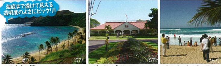
▲ハナウマ湾 ▲ドール・プランテーション ▲サンセット・ビーチ