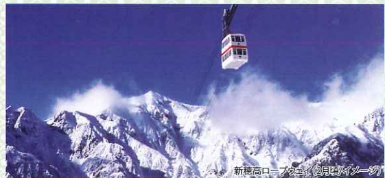
新穂高ロープウェイ(2月頃/イメージ)

北アルプスの大パノラマが楽しめる天空の旅へ。山頂の展望台では、笠ヶ岳や槍ヶ岳をはじめ、穂高連峰の姿を望めます。あたり一面が純白に染まる世界をお楽しみいただけます。