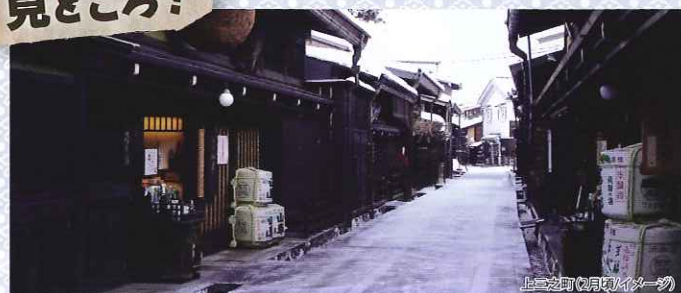
上宮廻り(2月頃/イメージ)

江戸時代の城下町・商家町の姿が今も保存されており、その景観から「飛騨の小京都」と呼ばれている飛騨高山。情緒あふれる街並みを満喫しながら、食べ歩きをお楽しみいただけます。