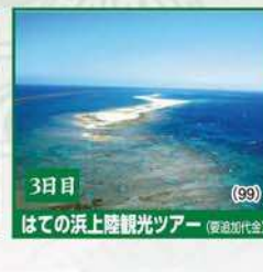
3日目 はての浜上陸観光ツアー (要追加代金)