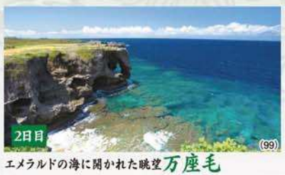
2日目 エメラルドの海に開かれた眺望 万座毛