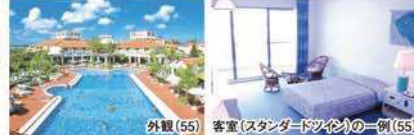
外観(55) 客室(スタンダードツイン)の一例(55)