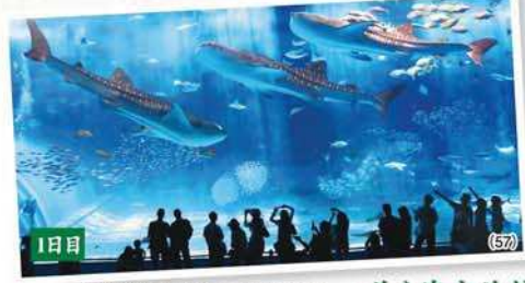
海洋博公園にある人気スポットの一つ 美ら海水族館