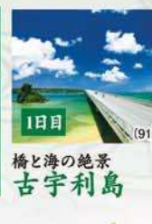
1日目 橋と海の絶景 古宇利島