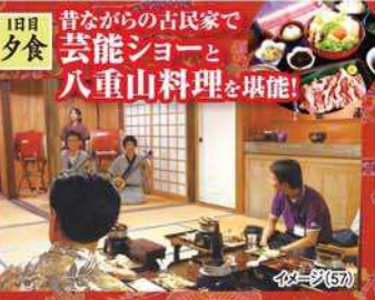
1日目 夕食 昔ながらの古民家で 芸能ショー と 八重山料理 を堪能!