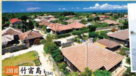
2日目 竹富島 (54) 昔ながらの沖縄に浸れる 旧集落

いしがじま 石垣島 たけとみじま 竹富島 こはまじま 小浜島 ゆふじま 由布島 いりおもてじま 西表島