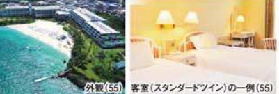
外観(55) 客室(スタンダードツイン)の一例(55)

2日目 久米島 リゾートホテル久米アイランド またはイーフビーチホテル ■お部屋/バス・トイレ付スタンダードツイン1~4名(約30~34㎡)