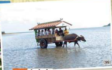
2日目 由布島 心も体もゆったり 水牛車