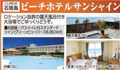
石垣島 ビーチホテルサンシャイン

ロケーション抜群の露天風呂付き大浴場でごゆっくりどうぞ。 ■お部屋/バス・トイレ付スタンダードツイン(グリーンビュー)1~3名(約24㎡) 露天風呂(55) 客室(スタンダードツイン)の一例(55)