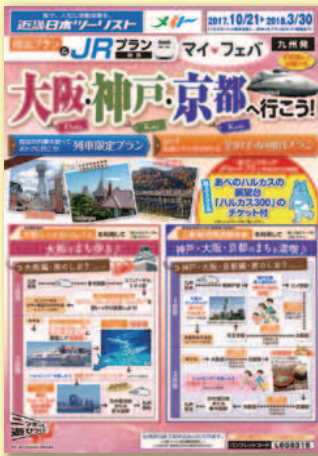
「大阪・神戸・京都へ行こう」 パンフレット表紙